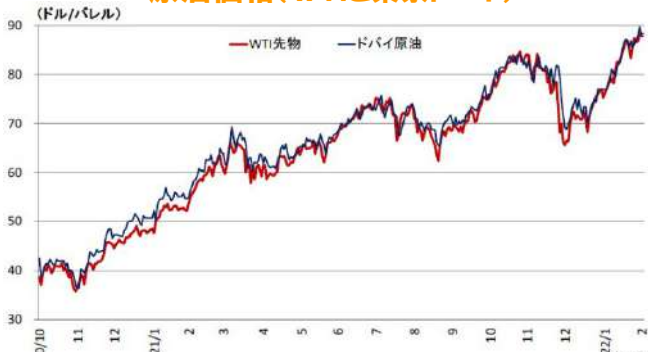
原油価格(WTIと東京ドバイ)

(注) WTI先物は期近物。ドバイは東京原油スポット市場中東産ドバイ原油、翌月または翌々月渡し、現物、FOB、中心値 (資料) Financial Times、日本経済新聞